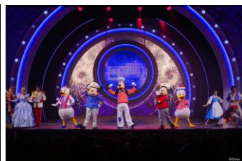
ディズニー・シーズ ザ・アドベンチャー