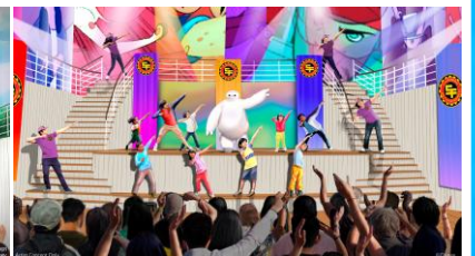
ベイマックス スーパーエクササイズエキスポ