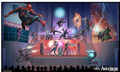
アベンジャーズ・ アッセンブル!!

華やかなブロードウェイスタイルのショー、楽しいデッキパーティー、映画上映、ディズニー、ピクサー、マーベルのお気に入りの仲間たちとの忘れられない交流会など、ディズニーの魔法を体験してください。※各種イベント、エンターテインメントは予告なく変更となる場合があります。予めご了承ください。