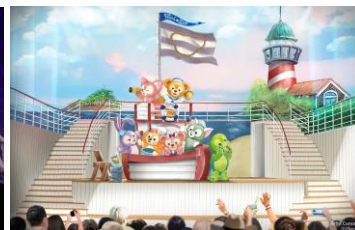
ダフィーと フレンドシップ