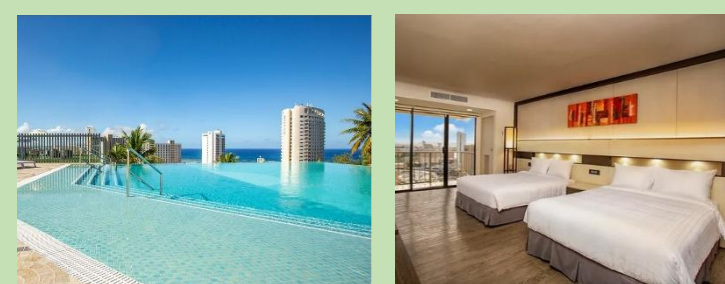
ホテル屋外プール(イメージ)