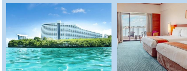
ホテル外観(イメージ)

全室オーシャンフロントの眺望、星の砂のビーチと広大なプール。日系ならではの美食とサービスで極上のリゾートステイを。