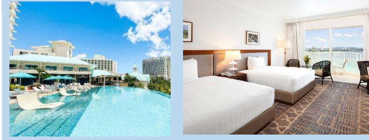
ホテル屋外プール(イメージ)

ビーチフロントの恵まれたロケーションにあり、青い海とパウダーサンドのビーチが目前に広がります。