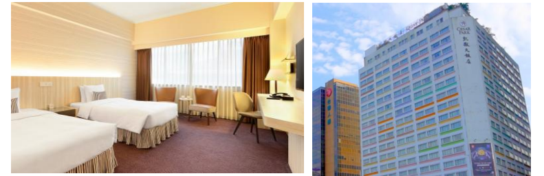
ホテル客室一例/イメージ

【チェックイン】15:00 【チェックアウト】12:00 【客室】部屋指定なし 【アクセス/最寄り駅】 MRT台北駅から徒歩約3分 【設定除外日】 6/9~6/17発