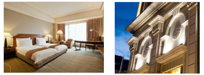
ホテル客室一例/イメージ

【チェックイン】15:00 【チェックアウト】11:00 【客室】部屋指定なし 【アクセス/最寄り駅】 MRT忠孝新生駅から徒歩約10分 【設定除外日】 6/9~6/21発