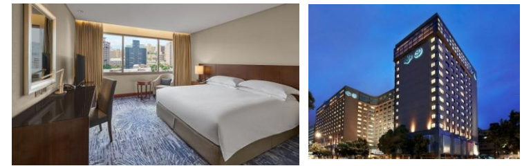
ホテル客室一例/イメージ

【チェックイン】15:00 【チェックアウト】12:00 【客室】部屋指定なし 【アクセス/最寄り駅】MRT善導寺駅から徒歩約3分 【設定除外日】6/9~6/17発