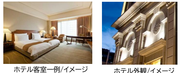
ホテル客室一例/イメージ

【チェックイン】15:00 【チェックアウト】11:00 【客室】部屋指定なし 【アクセス/最寄り駅】MRT忠孝新生駅から徒歩約10分 【設定除外日】6/9~6/21発