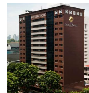
ホテル外観/イメージ

【チェックイン】15:00 【チェックアウト】11:00 【客室】 デラックスルーム 【アクセス/最寄り駅】 MRTプラスバサー駅から徒歩約5分 【設定除外日】 6/17~6/21発、9/30発