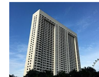
ホテル外観/イメージ

【チェックイン】15:00 【チェックアウト】12:00 【客室】 デラックスルーム 【アクセス/最寄り駅】 MRTプロムナード駅から徒歩約10分 【設定除外日】 なし