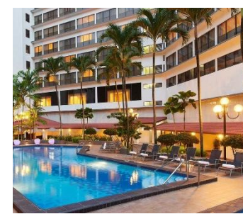
ホテル外観/イメージ

【チェックイン】15:00 【チェックアウト】11:00 【客室】 スーペリアルーム 【アクセス/最寄り駅】 MRTオーチャード駅から徒歩約6分 【設定除外日】 なし