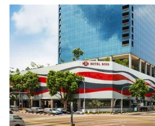
ホテル外観/イメージ

【チェックイン】15:00 【チェックアウト】11:00 【客室】 スーペリアルーム 【アクセス/最寄り駅】 MRTラベンダー駅から徒歩約7分 【設定除外日】 なし