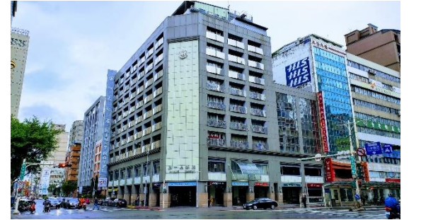
ホテル外観/イメージ

【チェックイン】15:00 【チェックアウト】12:00 【客室】部屋指定なし【アクセス/最寄り駅】MRT松江南京駅から徒歩約5分