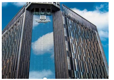
ホテル外観/イメージ

【チェックイン】15:00 【チェックアウト】11:00 【客室】部屋指定なし(窓あり)【アクセス/最寄り駅】MRT西門駅から徒歩約2分