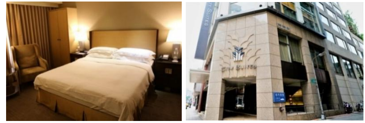
客室の一例/イメージ