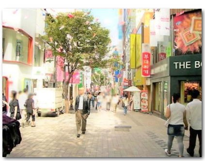
明洞街並み/イメージ