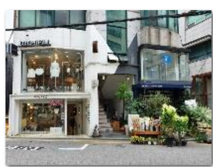
カロスクル/イメージ