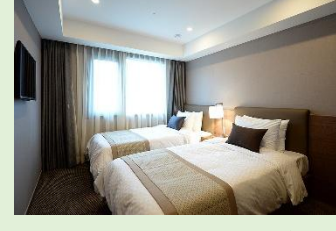
ホテル外観(イメージ)