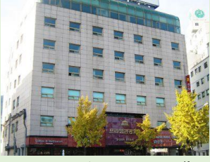
ホテル外観(イメージ)