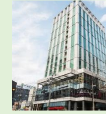
ホテル外観(イメージ)