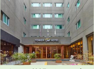
ホテル外観(イメージ)