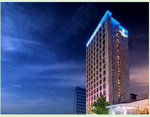
ホテル外観(イメージ)