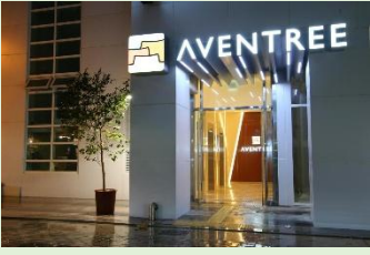
ホテル外観(イメージ)