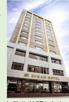
ホテル外観(イメージ)

ホテルインフォメーション 【チェックイン】 14:00 【チェックアウト】 11:00 【Wifi】 無料 【客室】 部屋指定なし 【アクセス】