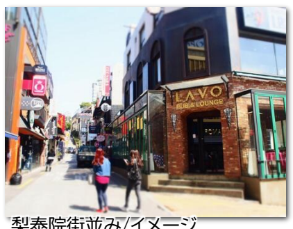
梨泰院街並み/イメージ