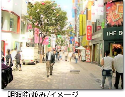
明洞街並み/イメージ