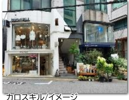
カロスギル/イメージ