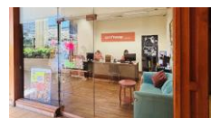
ツアーデスク/イメージ

ハイアットリージェンシーワイキキ ダイヤモンドヘッドタワー3階(ABCストア横) 営業時間:平日08:00~17:00