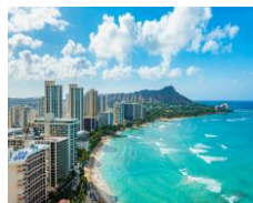
ワイキキビーチ/イメージ