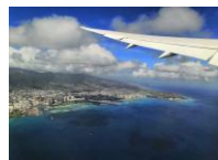
空から見るホノルル/イメージ