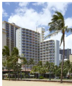
ホテル外観/イメージ

マラソンのゴール地点、カピオラニ公園の目の前。ゴール後すぐにお部屋に戻ることができる大変便利なロケーションです。ホノルル動物園、ワイキキ水族館も徒歩圏内。ハワイの美しいサンセットをご覧になるのに最適なサンデッキ付の海が見えるプールもあります。マラソン当日は当ホテル内に「ランナーズステーション」を設置します。