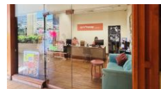
ツアーデスク/イメージ

ハイアットリージェンシーワイキキ ダイヤモンドヘッドタワー3階(ABCストア横) 営業時間:平日08:00~17:00