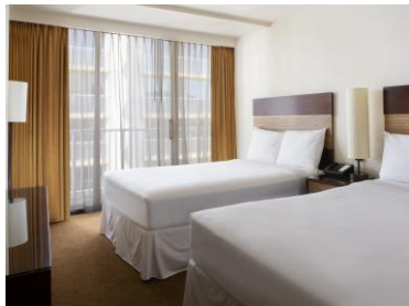
部屋の一例/イメージ

【チェックイン】15:00 【チェックアウト】11:00 【お部屋】2名1室利用：部屋指定なし/約19.5~27.7m 2 /全室禁煙/ベッド2台確約 1名1室利用：部屋指定なし/約19.5~27.7m 2 /全室禁煙/ベッド数指定なし ※バスタブがない部屋になる場合があります。