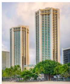
ホテル外観/イメージ

絶好のロケーションと充実した設備がそろうデラックスホテルです。全室プライベートバルコニー付きのゆったりしたお部屋でリゾート気分を満喫できます。当ホテル3階ABCストア横に「CTHツアーデスク」がございます。