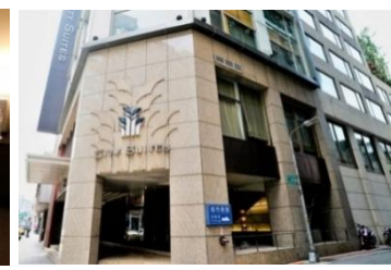
ホテル外観/イメージ

【チェックイン】15:00 【チェックアウト】11:00 【客室】部屋指定なし【アクセス/最寄り駅】MRT北門駅から徒歩約10分