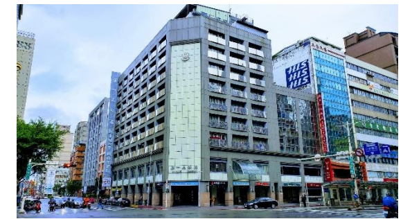
ホテル外観/イメージ

【チェックイン】15:00 【チェックアウト】12:00 【客室】部屋指定なし【アクセス/最寄り駅】MRT松江南京駅から徒歩約5分