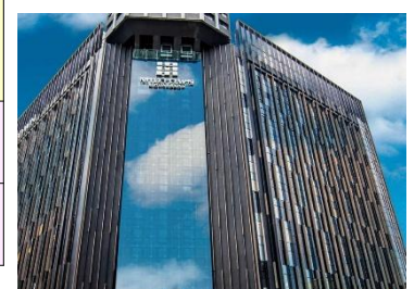
ホテル外観/イメージ

【チェックイン】15:00 【チェックアウト】11:00 【客室】部屋指定なし(窓あり)【アクセス/最寄り駅】MRT西門駅から徒歩約2分