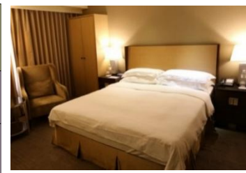
客室の一例/イメージ