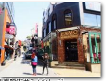
梨泰院街並み/イメージ