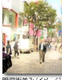
明洞街並み/イメージ