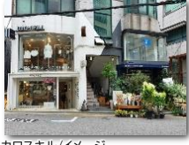
カロスキル/イメージ