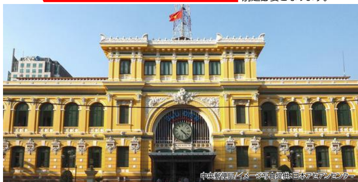
中央郵便局/イメージ写真提供:日本アジアセンター