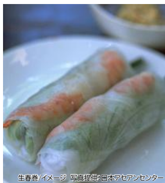
生春巻/イメージ

国内空港施設利用料、旅客保安サービス料、国際観光旅客税、現地空港諸税が別途必要となります。