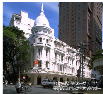
ドコイ通り/イメージ写真提供:日本アジアセンター