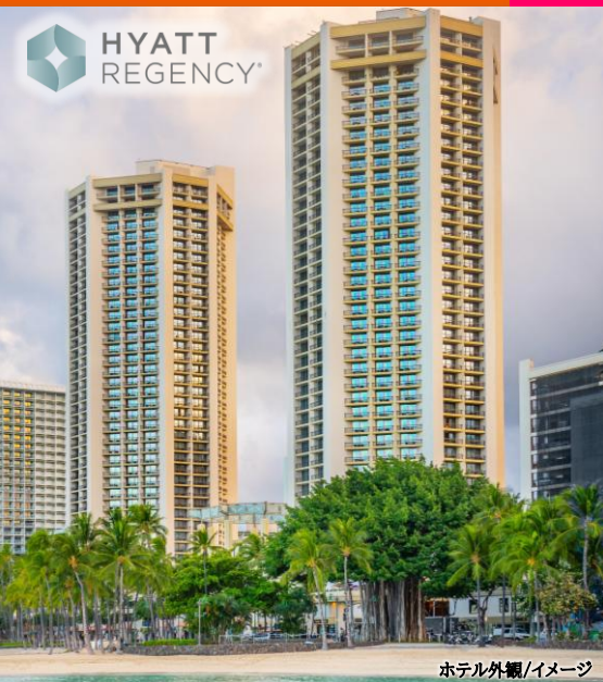
ホテル外観/イメージ