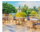
ダイヤモンドヘッドタワー3階 クラブラウンジイメージ

『リージェンシークラブラウンジ』がご利用いただける大人気プランです！ さらに本パンフレットでお申込みのお客様には通常は 有料サービスのアルコール(ビール&セルツァー& ワイン)を無料提供させていただきます！