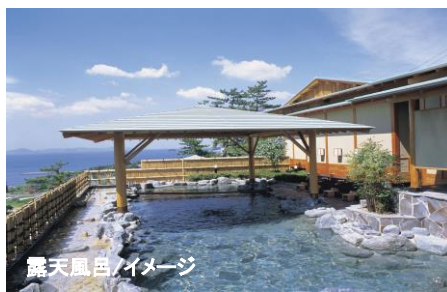
露天風呂/イメージ