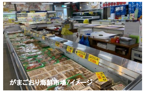
がまごおり海鮮市場/イメージ