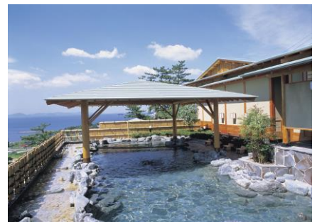
露天風呂(イメージ)