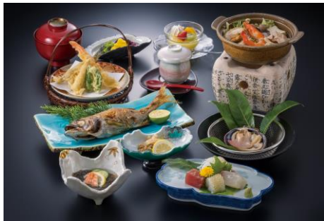
会席料理(イメージ)

但し、浴衣を着用の上、タオルは宿泊されますタオルをお持ちください。 ※混雑時はお断わりする場合がございます。予めご了承ください。