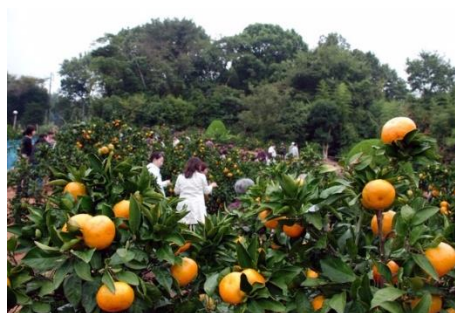
みかん狩り/イメージ