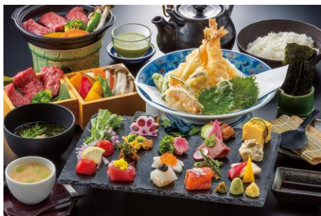
会席料理 (イメージ)

但し、浴衣を着用の上、タオルは宿泊されますタオルをお持ちください。 ※混雑時はお断わりする場合がございます。予めご了承ください。