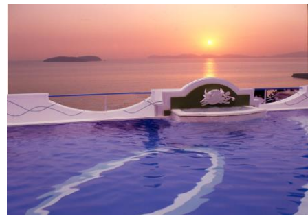
露天風呂 (イメージ)