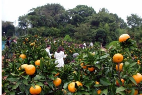
みかん狩り/イメージ