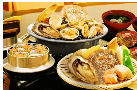
昼食(浜焼御膳)ノイメージ