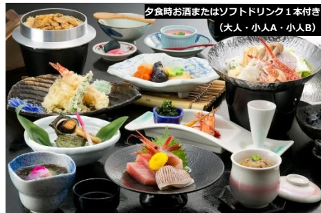
夕食時お酒またはソフトドリンク1本付き (大人・小人A・小人B)