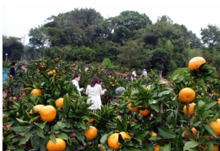
みかん狩りノイメージ