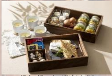
朝食:朝の宝宝箱(4人分)