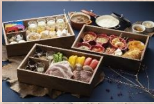
夕食:夜の宝宝箱(4人分)