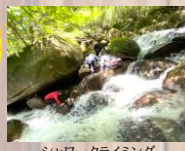
シャワークライミング

シャワークライミング他、火起こし体験、星空ハイク、高原の森ネイチャリングツアー等、宿泊者様限定イベントを随時行っております。詳しくはお問い合わせ下さい。