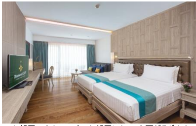
※お部屋の広さ45㎡※お部屋によって変更が生じます

日本人向けのサービスが充実した パトン湾を見下ろす人気リゾート ホテル。パトンビーチの北斜面に建 てられており、全室バルコニー付き で眺望も抜群。